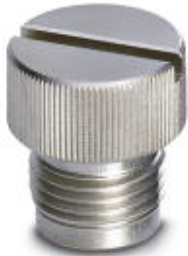
M12旋入式封盖，用于屏蔽式传感器 / 执行器电缆、分线盒和插座上未使用的M12连接位

Please be informed that the data shown in this PDF Document is generated from our Online Catalog. Please find the complete data in the user's documentation. Our General Terms of Use for Downloads are valid ( http://download.phoenixcontact.com )