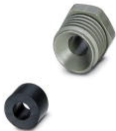
传感器/执行器连接器，附件，紧固螺母和密封，适用非屏蔽M8连接器，电缆直径2.2 mm - 3.5 mm

Please be informed that the data shown in this PDF Document is generated from our Online Catalog. Please find the complete data in the user's documentation. Our General Terms of Use for Downloads are valid ( http://download.phoenixcontact.com )