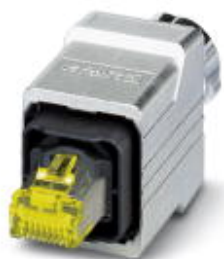
RJ45连接器，IP67，带推挽式互锁（14版），金属外壳，适用于10 Gbps，适用于AWG 24 ... 27 柔性导线

Please be informed that the data shown in this PDF Document is generated from our Online Catalog. Please find the complete data in the user's documentation. Our General Terms of Use for Downloads are valid ( http://download.phoenixcontact.com )