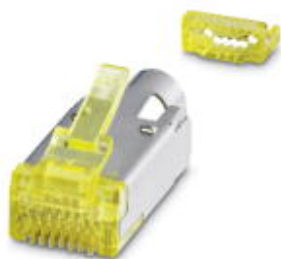
RJ45插头, CAT6 A , 10 G

Please be informed that the data shown in this PDF Document is generated from our Online Catalog. Please find the complete data in the user's documentation. Our General Terms of Use for Downloads are valid ( http://download.phoenixcontact.com )