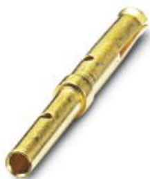
D-SUB压接插针，接线方式: 压接，接线容量: AWG 28- 22，High Density

Please be informed that the data shown in this PDF Document is generated from our Online Catalog. Please find the complete data in the user's documentation. Our General Terms of Use for Downloads are valid ( http://download.phoenixcontact.com )