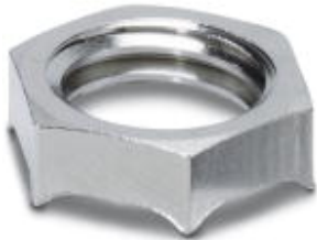
EMV螺母，黄铜，镀镍，线程 M16 x 1.5，颜色: 银色

Please be informed that the data shown in this PDF Document is generated from our Online Catalog. Please find the complete data in the user's documentation. Our General Terms of Use for Downloads are valid ( http://download.phoenixcontact.com )