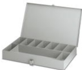
分类箱,金属,无安装组件

Please be informed that the data shown in this PDF Document is generated from our Online Catalog. Please find the complete data in the user's documentation. Our General Terms of Use for Downloads are valid ( http://download.phoenixcontact.com )