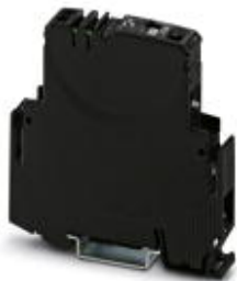
电子断路器，1个复位输入，额定电流：10 A

Please be informed that the data shown in this PDF Document is generated from our Online Catalog. Please find the complete data in the user's documentation. Our General Terms of Use for Downloads are valid ( http://download.phoenixcontact.com )