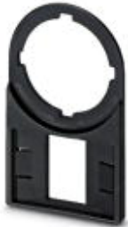
标记槽，黑色，未标记，安装方式: 螺钉，铆钉，直径: 22 mm，标识区域大小: 27 x 18 mm

Please be informed that the data shown in this PDF Document is generated from our Online Catalog. Please find the complete data in the user's documentation. Our General Terms of Use for Downloads are valid ( http://download.phoenixcontact.com )