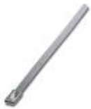
钢制电缆扎带，防锈，防磁