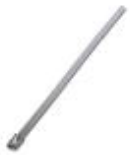
钢制电缆扎带，防锈，防磁