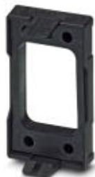
卡接式框架，类型: B10，长度: 108 mm，宽度: 64 mm，高度: 39 mm，颜色: 黑色

Please be informed that the data shown in this PDF Document is generated from our Online Catalog. Please find the complete data in the user's documentation. Our General Terms of Use for Downloads are valid ( http://download.phoenixcontact.com )