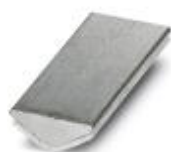
棱柱补偿块，颜色: 银色