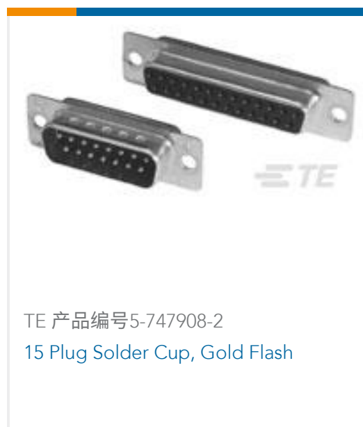
TE 产品编号5-747908-2 15 Plug Solder Cup, Gold Flash