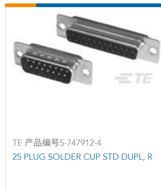
TE 产品编号5-747912-4 25 PLUG SOLDER CUP STD DUPL, R