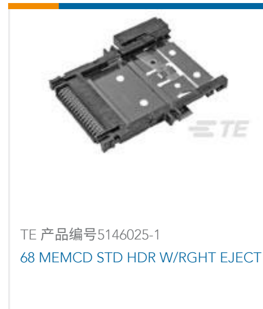
TE 产品编号5146025-1 68 MEMCD STD HDR W/RGHT EJECT