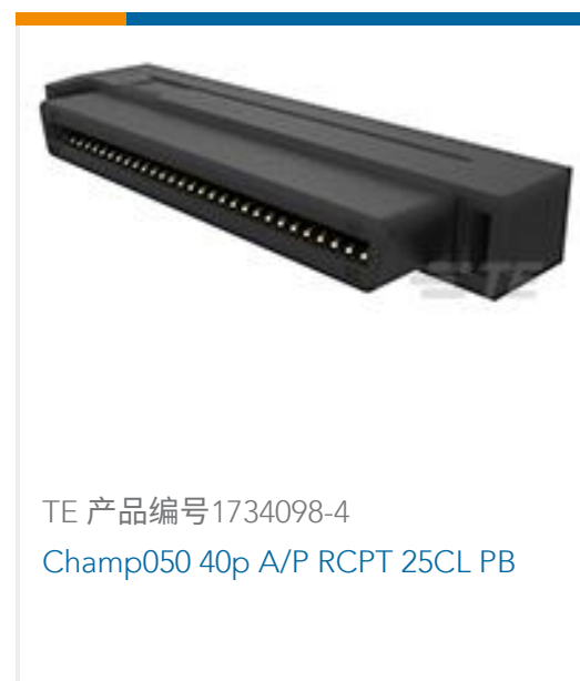
TE 产品编号1734098-4 Champ050 40p A/P RCPT 25CL PB