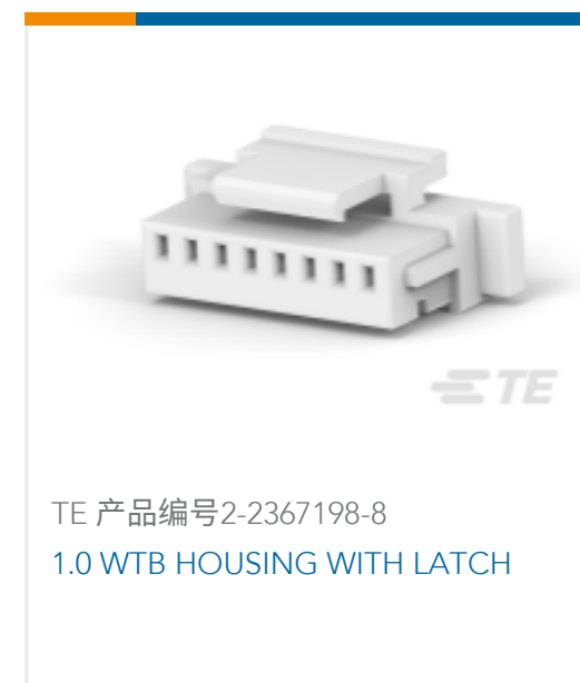
TE 产品编号2-2367198-8 1.0 WTB HOUSING WITH LATCH