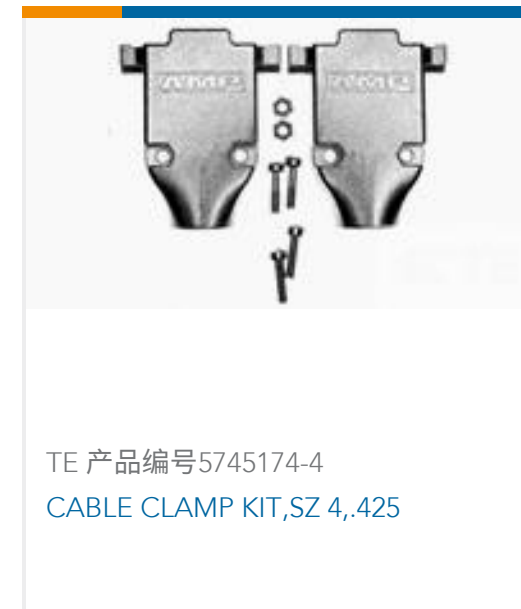
TE 产品编号5745174-4 CABLE CLAMP KIT,SZ 4,.425