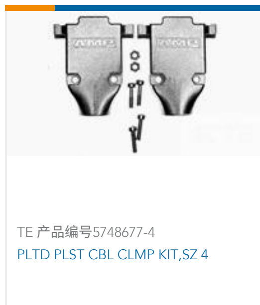
TE 产品编号5748677-4 PLTD PLST CBL CLMP KIT,SZ 4