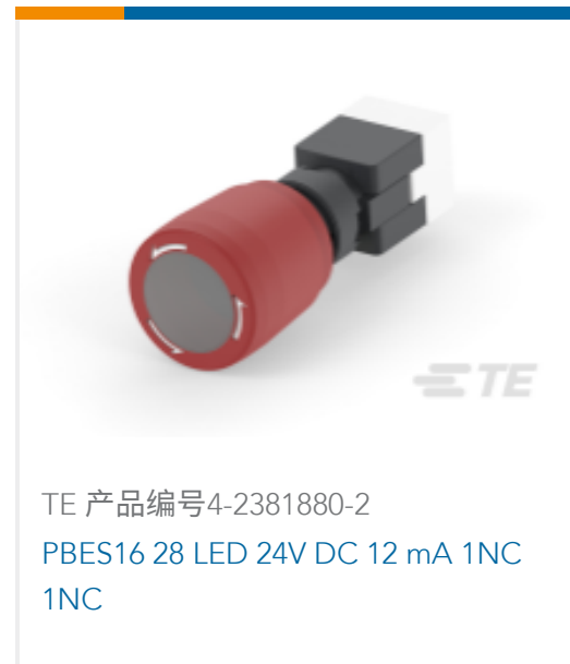
TE 产品编号4-2381880-2 PBES16 28 LED 24V DC 12 mA 1NC 1NC