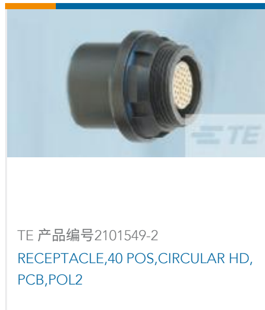
TE 产品编号2101549-2 RECEPTACLE,40 POS,CIRCULAR HD, PCB,POL2